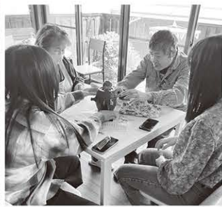
供しているのですが、

利用者さんにも食堂のスタッフとして、地域の子も達と自然に交流ができるのではと考へ、始めました。開催は毎月第4土曜日(7月は25日)の予定。高校生までは無料、大人は500円、定員20人で予約制。大人だけの利用もOKで、食事だけでなく、物作りのワークショップも同時開催し、みんな