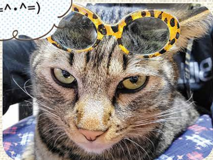
▲ちび(ミックス・♂・3歳) ねこさん(富田町)