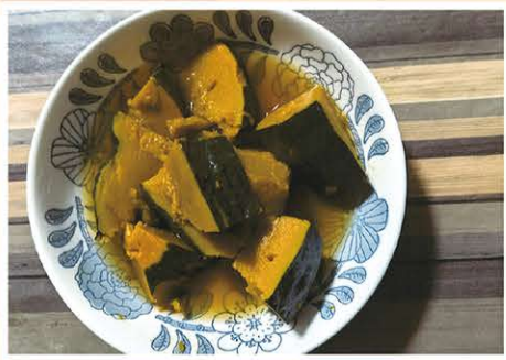
タイトル「かぼちゃの煮物」

美味しそうな作品のご投稿ありがとうございました。現在募集中のテーマは「祭り」です。