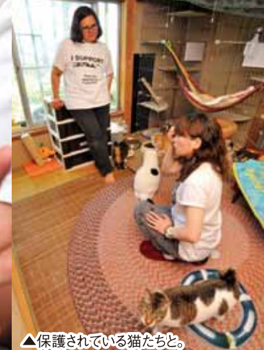
▲保護されている猫たちと。

■寄付やボランティアのお問合せは下記まで。 JCNのホームページ: www.japancatnet.com Eメール: info@japancatnet.com