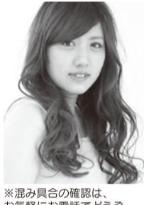
※混み具合の確認は、お気軽にお電話どうぞ。

予約いらずで好評の美容室「スペースBE」の6月までのおトク企画。ベテランの女性スタイリストが多くて安心!平日の午後が狙い目ですよ。○使用薬剤は国産メーカーより直接入荷する事で叶う低価格!