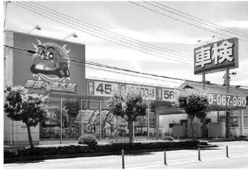
3月・4月は混み合いますのでお早めにご予約ください。

■最短45分の「速さ」 車検の速太郎の最大の特徴は「速さ」。車検専門の検査員と整備士の2人体制で迅速に対応するため、最短45分で車検ができます。お客様はその場でお車に乗って帰れるから代車も必要ありません。 ■安心の立合い車検 速太郎の立合い車検とは、検査員が車を見ながらお客様に、車の状態、部品交換が必要かどうかなど、わかりやすく説明を行います。 ★土・日・祝日も営業していますので、平日はお仕事の方も大丈夫。 車検の速太郎郡山店 ☎0120-067-960 郡山市備前館2丁目104 営業時間 9:00~18:00 定休日 毎週火曜日第1水曜日 速太郎郡山店 検索