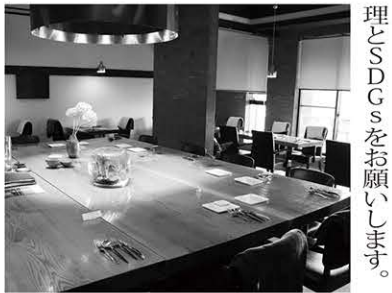
リストランテマルテッロの店内

ため、まずカラナブキンをやめ、お着物の方等ご希望がある方だけにご提供しています。それからお手拭きを厚手の物に変えたことで、何枚も欲しいと言われることがなくなりました。なるほど、効果はいかがですか? 「45ℓのゴミ袋で月8〜10個程度減量できました」それは素晴らしい効果です。他にも何かなさっていますか? 「お料理が食べきれない場合はお持ち帰