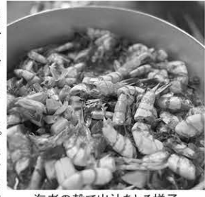
海老の殻で出汁をとる様子

ため、まずカラナブキンをやめ、お着物の方等ご希望がある方だけにご提供しています。それからお手拭きを厚手の物に変えたことで、何枚も欲しいと言われることがなくなりました。なるほど、効果はいかがですか? 「45ℓのゴミ袋で月8〜10個程度減量できました」それは素晴らしい効果です。他にも何かなさっていますか? 「お料理が食べきれない場合はお持ち帰