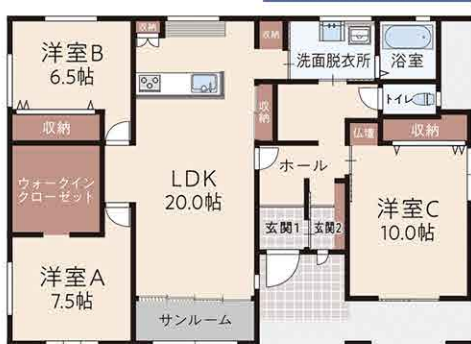
3LDK + サンプルルーム 延床面積 / 115.51㎡ (34.87坪)