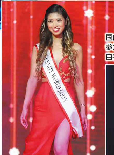
国内外、様々な大会やコレクションに参加。ポージングは、レッスン参加や自宅で動画を参考に練習します。