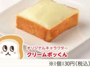
オリジナルキャラクター クリームボックスくん

郡山の人気ご当地パン「クリームボックス」は、濃厚でなめらかなミルククリームと厚切りのふわふわ食パンがベストマッチ!!他にも定番のホワイトや食パンをはじめ変わらぬおいしさで長年愛され続けています。