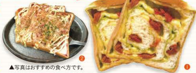
▲写真はおすすめの食べ方です。

①トマト&バジル 1斤900円/ハーフ480円(税込) オイル漬けセミドライトマトに生バジル、ガーリック&ジェノパソースに角切りチーズも絡めました。おつまみにもおすすめ! ②お好み焼き食パン 1斤680円/ハーフ370円(税込) 練り込まれた紅生姜がアクセント。 ※焼き上がり時間はお問い合わせください