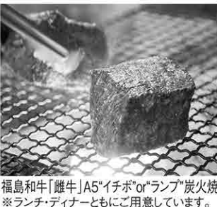
福島和牛「雌牛」A5「イチボ」or「ランプ」炭火焼 ※ランチ・ディナーともにご用意しています。