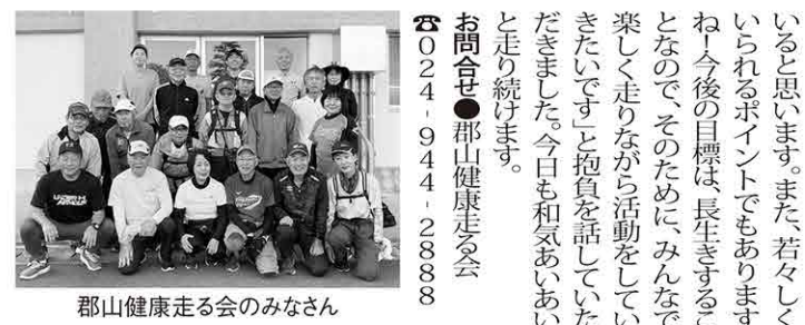
郡山健康走会のみなさん

●今週号では、毎年5月と12月に掲載している恒例企画「あなたの町のホームドクター」を掲載しています。 ●大きめの地図とクリニックの情報をカラー3ページにわたって転入してきた方、かかりつけ医を探している方など、ぜひ保存版としてお役立てください。