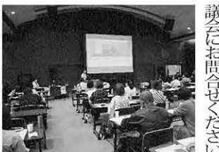
子ども食堂の取り組みについての研修

色んな世代の方が集まると配られちゃう コチマ 皆さん お菓子どうぞ お先にどうぞ なので 写真にあげるのモある? ミックスあるけどないの? ランダムなの? もち最中だけ!