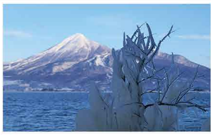
タイトル「しぶき氷と磐梯山」

いかにも寒そうな写真が届きました。撮影は大変だったことでしょう。まだまだ作品は募集中!