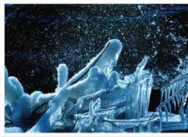
タイトル「荒湖の冬 飛沫走る」