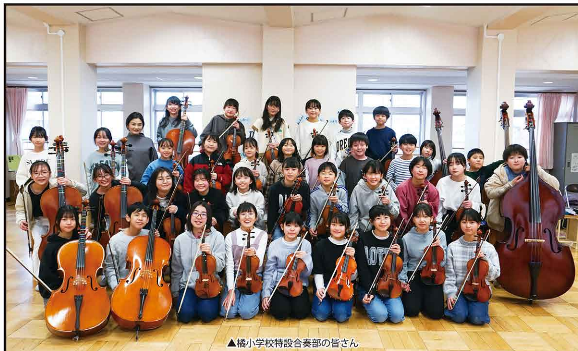
▲橘小学校特設合奏部の皆さん

去る11月5日(日)、けんしん郡山文化センターで、第12回日本学校合奏コンクール2023全国大会ソロ&アンサンブルコンテストが開催され、アンサンブル部門小学校の部に郡山市立橘小学校合奏部が出場し、金賞と全国1位相当の文部科学大臣賞を受賞しました。2年連続での受賞ということで、学校中が歓喜に沸いたことでしょう。また、11月18日(土)に千葉県の南総文化ホールで行われた、第12回日本学校合奏コンクール2023全国大会グランドコンテストでは、創設初の金賞、会長賞(4位相当)受賞と素晴らしい結果を残した橘小学校合奏部の皆さんにお話を伺いました。