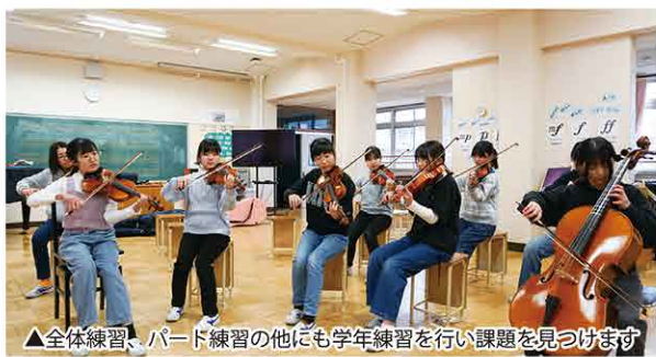
▲全体練習、パード練習の他にも学年練習を行い課題を見つけます

「結果を発表されたときは、驚きと嬉しさでいっぱいでした。今までみんなと一緒に積み上げてきた努力が結果になりました。また、支えてくれた方々に感謝です。」