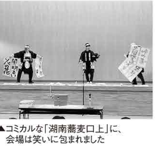
▲コミカルな「湖南蕎麦口上」に、会場は笑いに包まれました