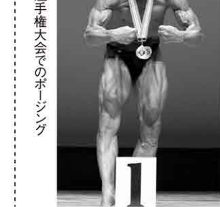
▲マスターズ選手権大会でのポージング

平日は毎日6時間、曜日ごとに胸や背中など5部位に分けてトレーニングをしており、3月から6ヶ月かけて約10kgの減量を行うとのこと。優勝したいという目標があったからこそ続けてこれた。また、体が変わると気持ちも強くなるんですよ。次の日本マスターズ選手権大会で、2連覇することが今の目標です」と今日もトレーニングに励みます。