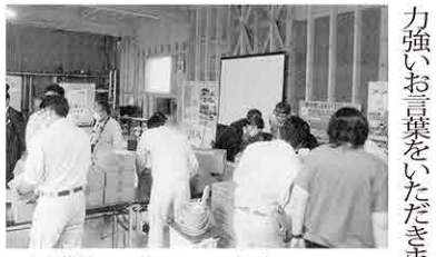
▲避難者の受け入れを想定した防災訓練の様子

「東日本大震災をきっかけに再生可能エネルギーに本格的に取り組みことにしました」と代表の 「ZEB」(ネット・ゼロ・エネルギービル)とは、エネルギーの消費が実質ゼロの建物のこと。新協地水では、太陽光発電等の創エネと地中熱を利用する省エネ、使うエネルギーの効率化で「ZEB」を達成しました。まだ全国的にも珍しく、全国の官民から学生まで、約123団