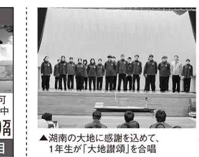
▲湖南の大地に感謝を込めて、1年生が「大地讃頌」を合唱