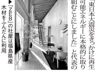
「ZEB」の社屋は福島県産木材をふんだんに利用