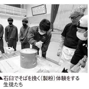
▲石臼でそばを挽く(製粉)体験をする生徒たち