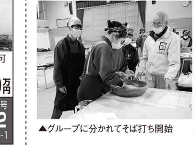
▲グループに分かれてそば打ち開始