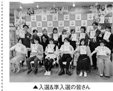
▲入選&準入選の皆さん