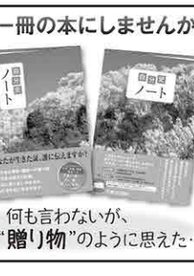
何とも言えないが、家族への「贈り物」のように思えた...

大切な思い出、貴重な記録。あなたの人生を一冊の本にしませんか。 リバーシブル 自分史ノート 880円 (税込) わかりやすい自分史の書き方解説付き みどり書房さんにて好評発売中!! 共栄印刷株式会社 郡山市田村町上行合字西川原7-5 ☎024-943-0001