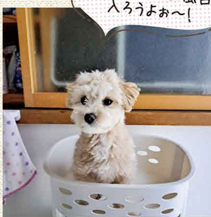
ママ〜、早くお風呂入ろうよお〜!