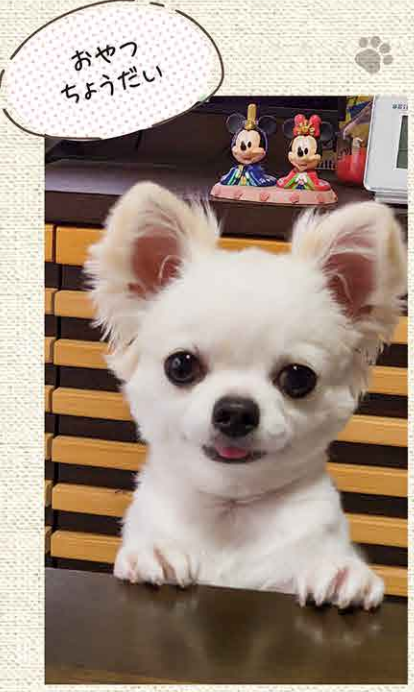
おやつちょうだい

「わが家のペット大集合」にたくさんのご投稿ありがとうございました。 掲載にいらなかったお写真も順次紹介していきますので、皆さまお待ちくださいませ。