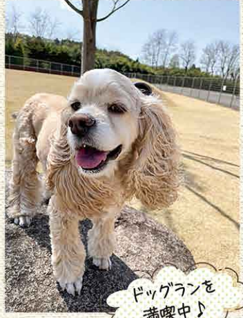
ドッグランを満喫中!