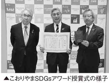
▲こおりやまSDGsアワード授賞式の様子