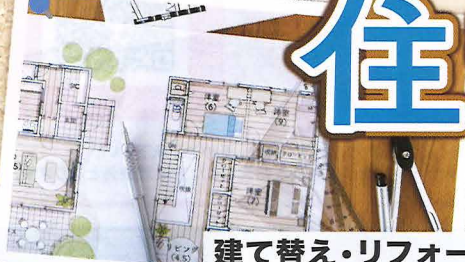
建て替え・リフォーム