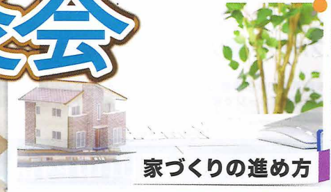
家づくりの進め方