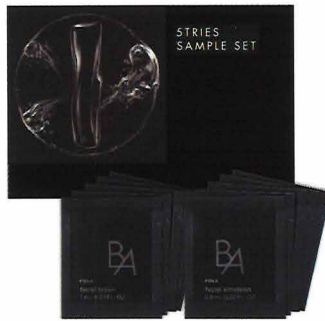
ベストコスメ受賞*アイテム 体感サンプルセット