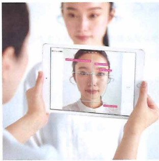
ポーラ独自の分析テクノロジーを用いた肌分析