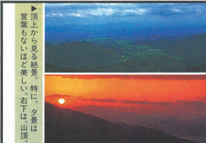
▶頂上から見る絶景。特に、夕景は言葉もないほど美しい。右下は、山頂。